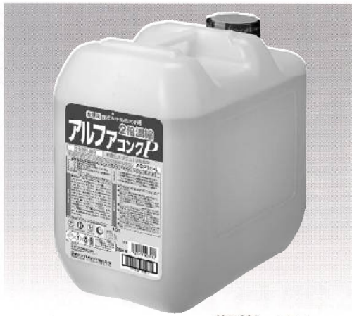
〈個装〉 15 kg