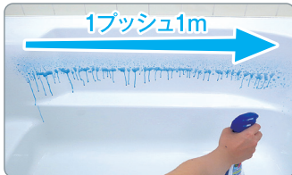
※撮影用に色を強めています。

腕をスライドさせながら、ゆっくりシュ———っとスプレーすれば1回で約1mの範囲にミストがかけられます。