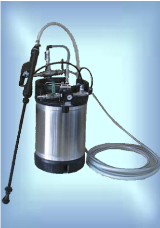
スプレーイングシステムス ジャパン社製