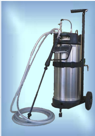
スプレーイングシステムス ジャパン社製