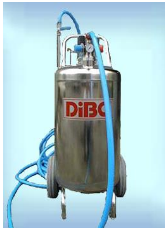
DiBo社製 フォームディスペンサー